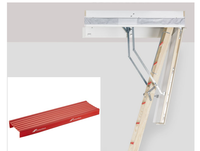
Stufenengel - für Stufenschutz während der Bauphase als optionales Zubehör erhältlich