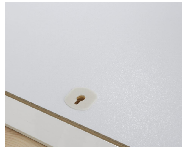
Flächenbündiger Verschluss ohne Zughaken

Klima-Dicht-System bedeutet Verschlusstechnik aus dem Fensterbau. Die Bodentreppen Designo und Quadro schließen sicher dicht mit Deventer-Fensterdichtungen und Roto Fensterbeschlägen 100% geprüft.