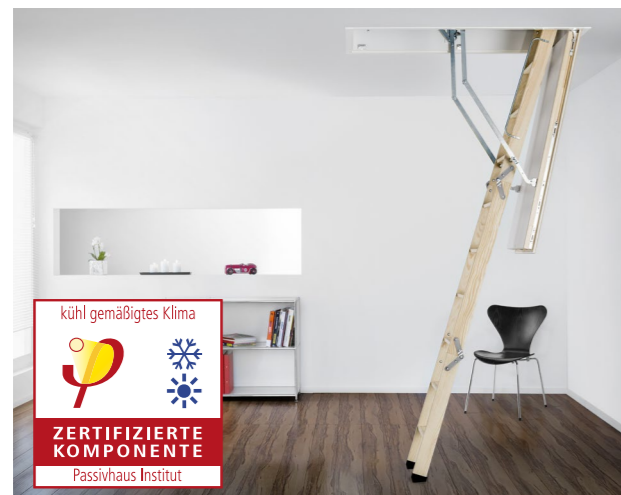
Bodentreppe Designo Passivhaus - jetzt auch mit Passivhaus Zertifizierung U_D = 0,63 \text{ W/(m}^2\text{K)}

besteht aus der für das Passivhaus zertifizierten Bodentreppe, der Standardversion Designo für gedämmte Geschossdecken und der Designo DD mit oberem Deckel für Kaltdach-Situationen.