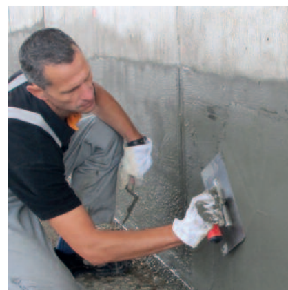
PCI Barraseal ist plastisch-geschmeidig. Poren und Vertiefungen werden leicht und schnell geschlossen.